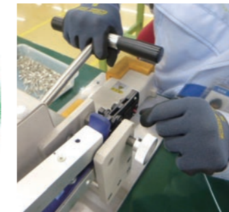
リード線組立作業

社員がより能力を高めていけるよう作業方法を工夫し、能力を発揮できるよう改善を行っています。