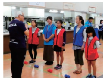
津フェスティバル