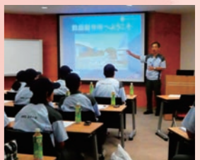
社外研修 住友電装(株)鈴鹿製作所