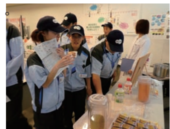
健康・環境フェスティバル