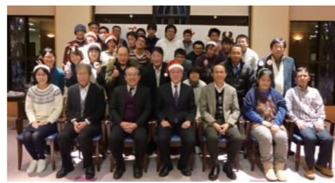
クリスマスパーティ