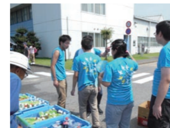
津フェスティバル受付協力