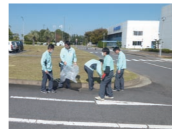
一斉清掃イベント参加