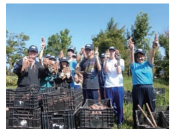
芋ほり、緑化作業協力

住友電装グループの社員として津製作所内のイベントに参加し、協力もさせて頂いています。